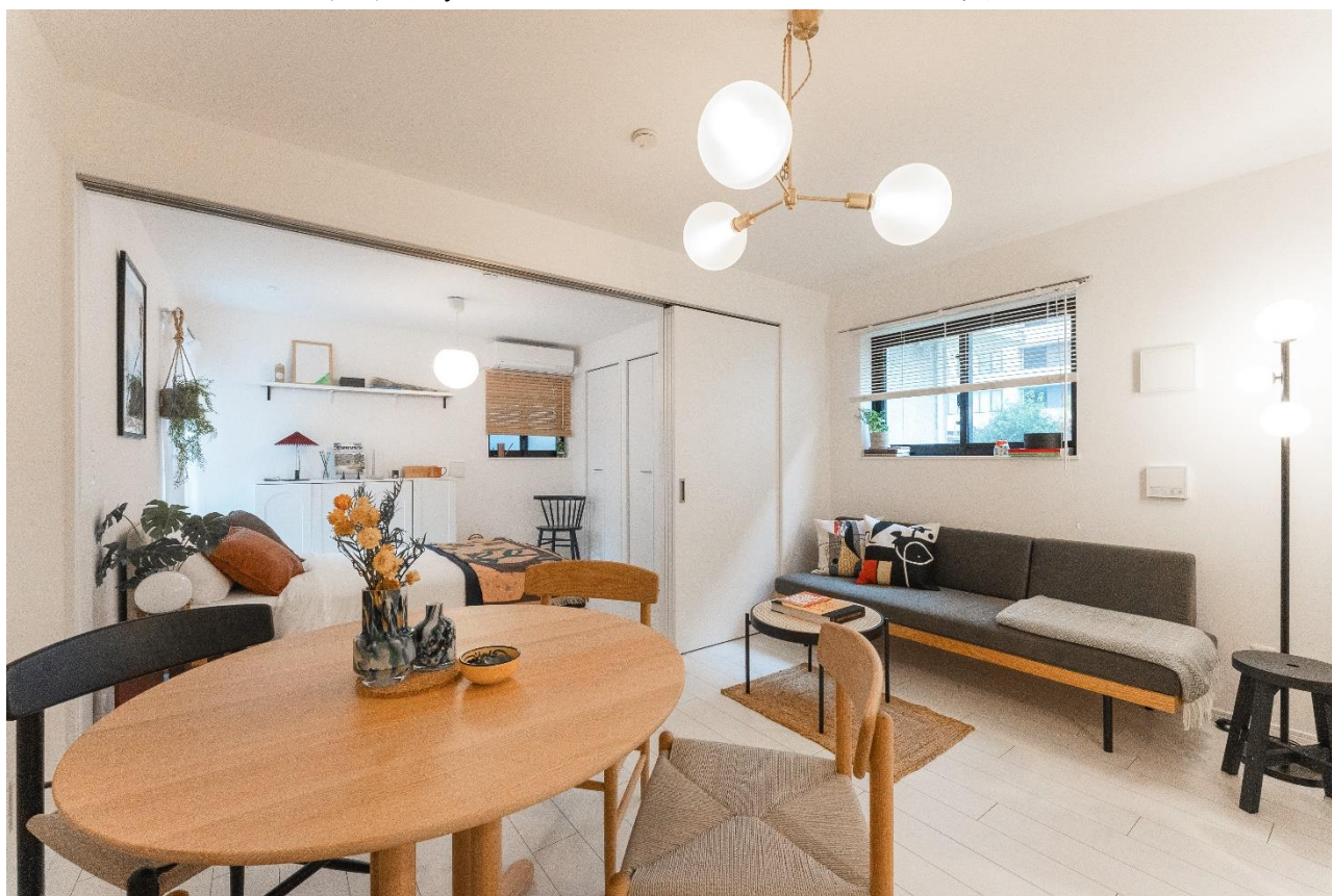
新設したモデルルーム「EL FARO 目黒 I」