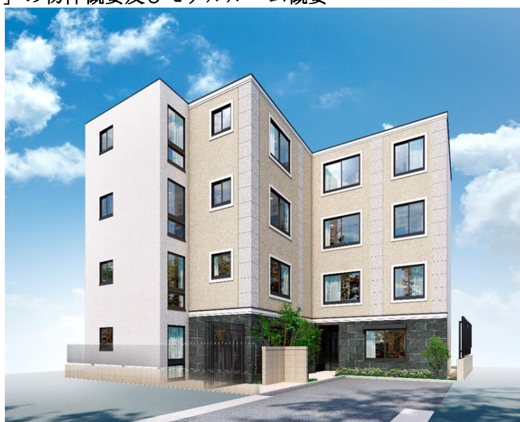
「EL FARO 目黒 I」