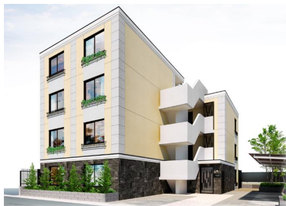
※「EL FARO 笹塚 II」