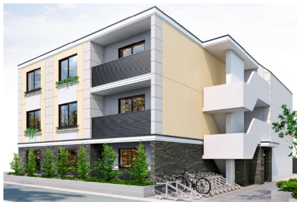
※「EL FARO 笹塚 I」

セミナー詳細につきましては、公式 HP ( https://meiho-est.com/ ) や公式 Twitter ( https://mobile.twitter.com/meihoenterprise ) 等にて随時お知らせいたしますのでどうぞご確認ください。