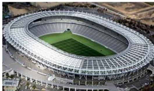
※東京スタジアム 2019年9月竣工