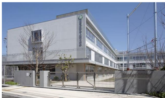
※下北沢小学校 2018年3月竣工