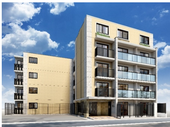
「EL FARO (エルファーロ)」

当社の新築1棟投資用賃貸マンション「EL FARO (エルファーロ)」、新築1棟投資用賃貸アパート「MIJAS (ミハス)」は地盤が強く、資産価値の下がりにくい城南・城西地区を中心に展開しております。両シリーズとも平均稼働率約98% (2023年2月時点)、優れた立地条件と魅力的なデザイン、上質な設備・仕様で高稼働・長期間稼働を実現すると共に、資産防衛、相続税対策に有効な安定的投資用商品としてお客様にご支持をいただいております。