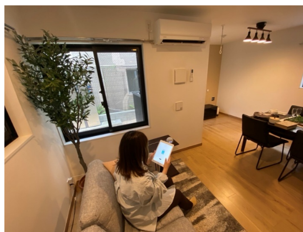
「パッとスマート」設定風景イメージ