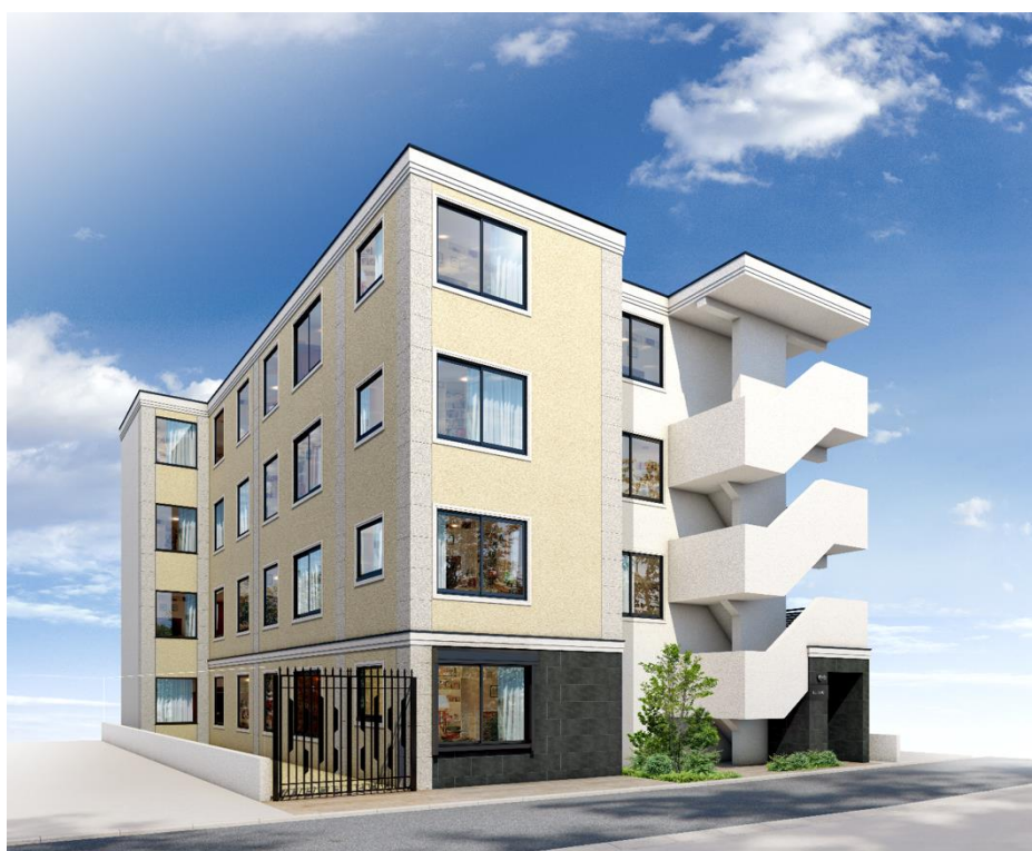
竣工した「EL FARO 三軒茶屋Ⅱ」