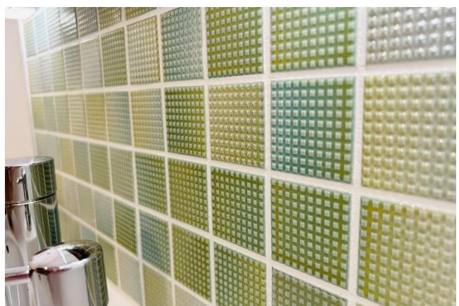
水回りを彩るモザイクタイル